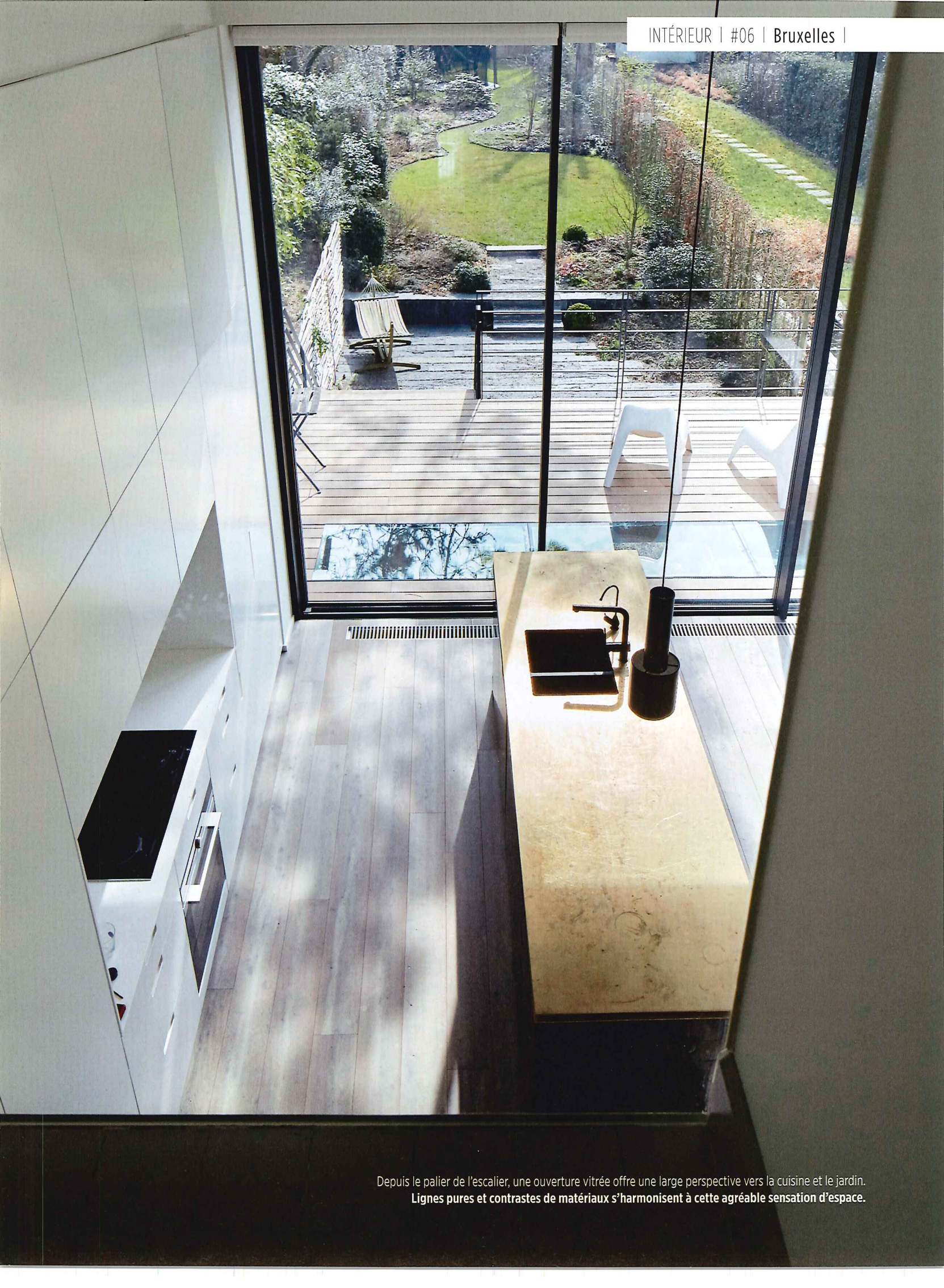
Depuis le palier de l'escalier, une ouverture vitrée offre une large perspective vers la cuisine et le jardin. Lignes pures et contrastes de matériaux s'harmonisent à cette agréable sensation d'espace.